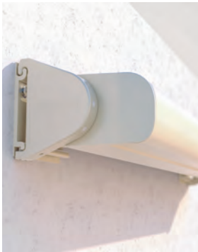
Design arrondi ou carré