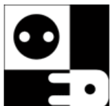
Schéma d'ensemble : pour l'électricien